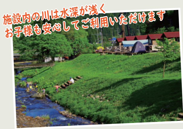
施設内の川は水深が浅く お子様も安心してご利用いただけます